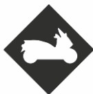
PERMIS MAXI SCOOTER